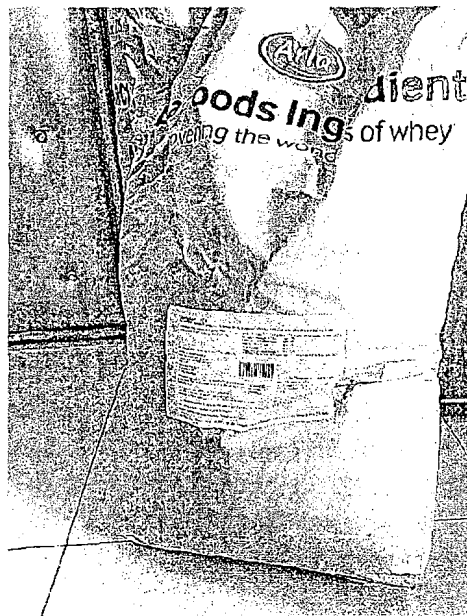
Illustration photo :